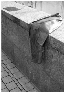
Gedenkstelle auf der blauen Brücke an die Deportation von jüdischen Bürgerinnen und Bürgern nach Gurs

Am 27. Januar 1945 wurden die Überlebenden des nationalsozialistischen Konzentrations- und Vernichtungslagers Auschwitz-Birkenau durch Soldaten der Roten Armee befreit. Seit 1996 wird der 27. Januar als Tag des Gedenkens an die Opfer des Nationalsozialismus in der Bundesrepublik Deutschland begangen. Im November 2005 erklärte die Vollversammlung der Vereinten Nationen den 27. Januar zum "International Day of Commemoration in Memory of the Victims of the Holocaust".