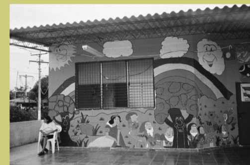
Mara-Rehabilitationsprojekt, El Salvador 2006

Veranstalter: cine rebelde, Spanische RDL-Sendung poder latino